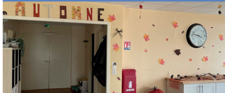
Aider et soulager les aidants